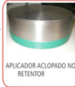
APLICADOR ACLOPADO NO RETENTOR