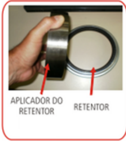
APLICADOR DO RETENTOR RETENTOR