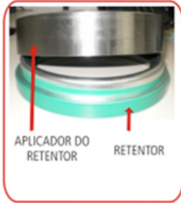
APLICADOR DO RETENTOR RETENTOR